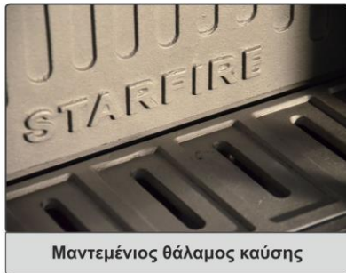
Μαντεμένιος θάλαμος καύσης