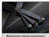
Μηχανισμός τάμπερ καυσαερίων