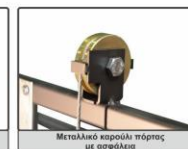
Μεταλλικό καρουλάκι πόρτας με ασφάλεια