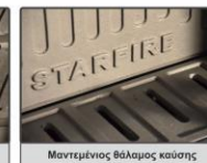
Μαντεμίνιος θάλαμος καύσης