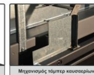
Μηχανισμός τάμπερ καυσαερίων