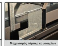
Μηχανισμός τάμπερ καυσαερίων