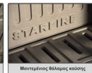
Μαντεμίνιος θάλαμος καύσης