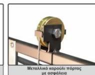
Μεταλλικό καρουλάκι πόρτας με ασφάλεια