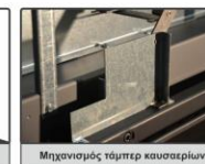
Μηχανισμός τάμπερ καυσαερίων