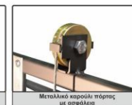
Μεταλλικό καρουλάκι πόρτας με ασφάλεια