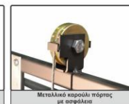
Μεταλλικό καρουλάκι πόρτας με ασφάλεια