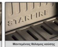
Μαντεμίνιος θάλαμος καύσης