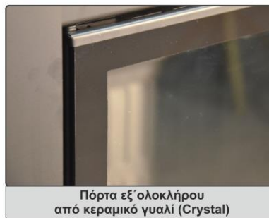
Πόρτα εξ' ολοκλήρου από κεραμικό γυαλί (Crystal)