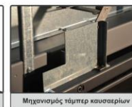
Μηχανισμός τάμπερ καυσαερίων